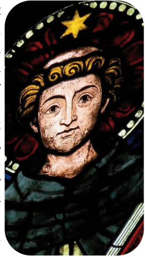
Saint Dominique (Colmar)