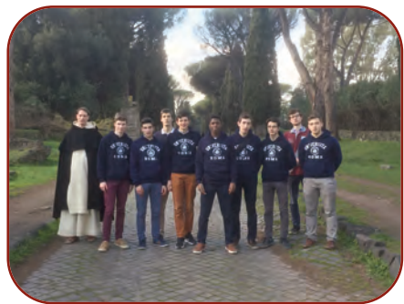
Les élèves de Terminale du Foyer Saint-Thomas à Rome