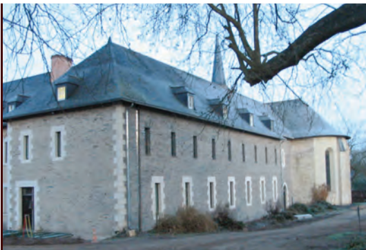
L'aile Est achevée

suivre : la réfection de l'aile Ouest, la construction d'une salle d'étude au prieuré, etc.