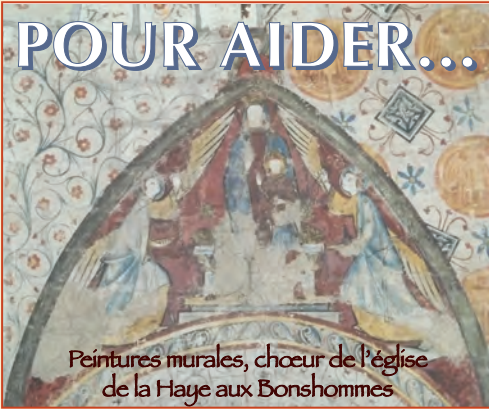
Peintures murales, chœur de l'église de la Haye aux Bonshommes