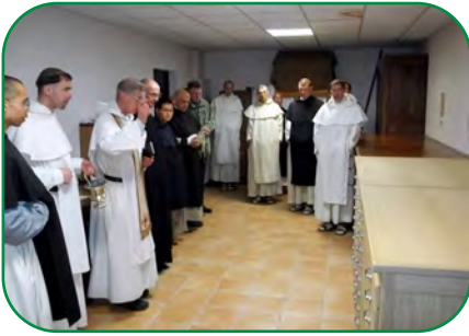
Bénédictio des chasubliers (9 avril).

plus, prêchant la foi catholique et en garantissant la protection et la survie par les sacrements de l'ordre et de la confirmation.