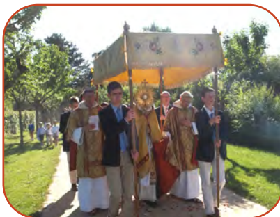
Procession de la Fête-Dieu (7 juin).

– Le soir : bannir les écrans qui empêchent la vie de famille ; faire la prière en commun, se fixer une heure pour le coucher.