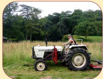
Fauchage des prairies du couvent.

Comptant sur vos prières et vous assurant des nôtres, nous recommandons à votre générosité le développement matériel de nos œuvres et l'ensemble de nos travaux. ■