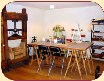
La salle de reliure de « Biblia ».

L'AMÉNAGEMENT et le classement des livres de la bibliothèque se poursuivent. Dans notre dernière Lettre (n° 73), nous