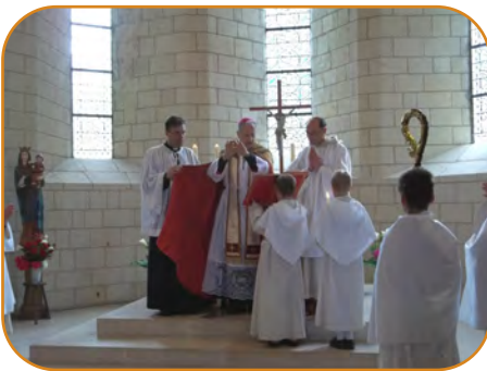
Confirmations (23 mai 2015).

❑ Samedi 16 mai. Père Terence accompagne la classe de seconde en Vendée pour deux jours, sur les traces des valeureux combattants de la foi.