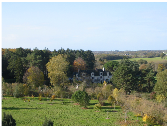
Le prieuré vu du couvent

Depuis 2001 le couvent a pris en charge une école primaire, l'école Sainte-Philomène, et depuis 2003 un collège-lycée, le Foyer Saint-Thomas.