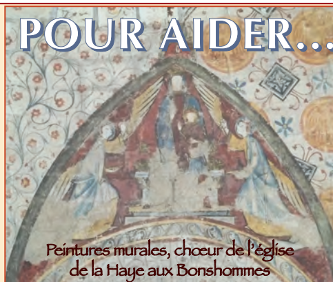
Peintures murales, chœur de l'église de la Haye aux Bonshommes