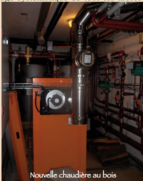
Nouvelle chaudière au bois

Ce que vous avez fait à l'un de ces plus petits d'entre mes frères, c'est à moi que vous l'avez fait (Mt 25, 40).