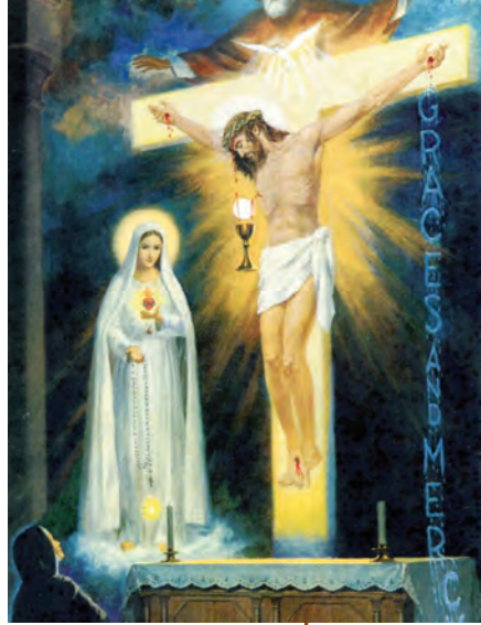
Icone trinitaire de Tuy

Voyez-vous maintenant le plan astucieusement combiné de l'ennemi ? Parmi ses ruses sans nombre, il crie contre les armuriers, contre les maîtres d'armes, contre les officiers instructeurs, afin d'endormir le soldat, afin de lui faire négliger l'exercice et le maniement des armes les plus nécessaires. Cette ruse ne lui a que trop bien réussi. Aujourd'hui même, combien de catholiques fidèles ne se laissent pas encore prendre à ces vieilles criailleries contre Aristote et les scolastiques ? Ouvrons au moins les yeux après trois siècles d'expérience.