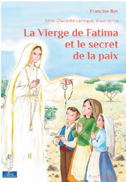
Illustration Anne-Charlotte Larroque, Téquì, 2016

re mondiale (23 mai). – «Tous ensemble, avec un grand coeur, prions pour qu'il y ait une paix définitive, et pas de guerre, pas de guerre» (16 mai). – Que Marie intercède pour la paix dans le monde (9 mai). – «Que la paix progresse», a prié le Pape (1 er mai).