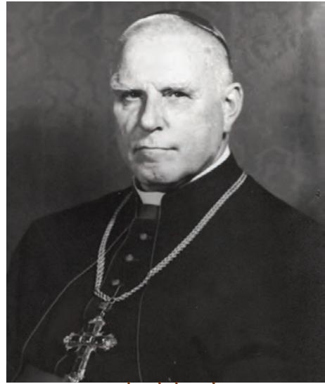
Mgr von Galen, le lion de Münster

— tous les évêques titulaires de la Légion d'Honneur: NNSS de Moulins-Beaufort (Reims), Ulrich (Paris), Delannoy (Strasbourg), d'Ornellas (Rennes), Le Boulc'h (Lil-