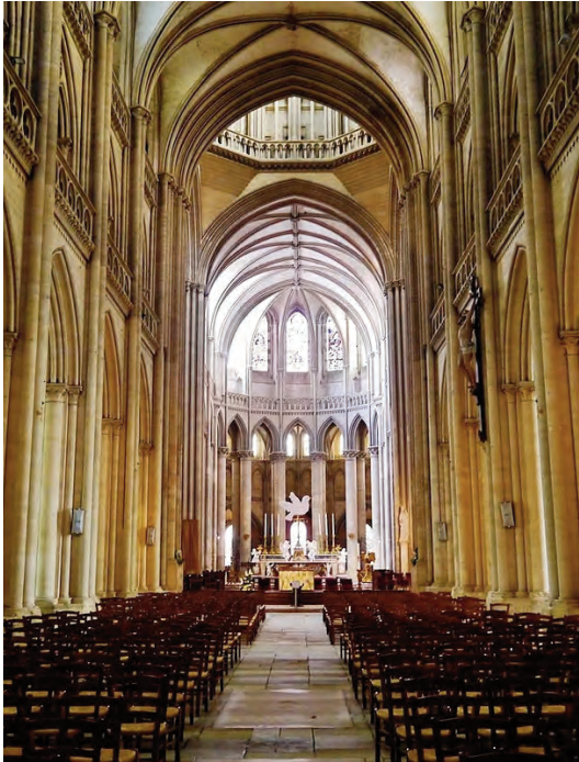
Cathédrale de Coutances

Dimanche dernier 26 mai, la cathédrale de Coutances a été le théâtre d'un concert intitulé « L'homme armé, une messe pour la paix ». Une « messe » pas très catholique puisque cette oeuvre musicale contient l'adhan, l'appel à la prière musulmane dont le message antichristique est clair : « Allah est le plus grand / Je témoigne qu'il n'y a pas de Dieu, excepté Allah / Je témoigne que Mohamed est le messager d'Allah / Venez vite vers la prière / Venez vite vers le succès / Allah est le plus grand / Il n'y a pas de Dieu, excepté Allah. » C'est la même oeuvre blasphématoire qui a été interprétée à Saint-Louis des Invalides le 22 mai 2019.