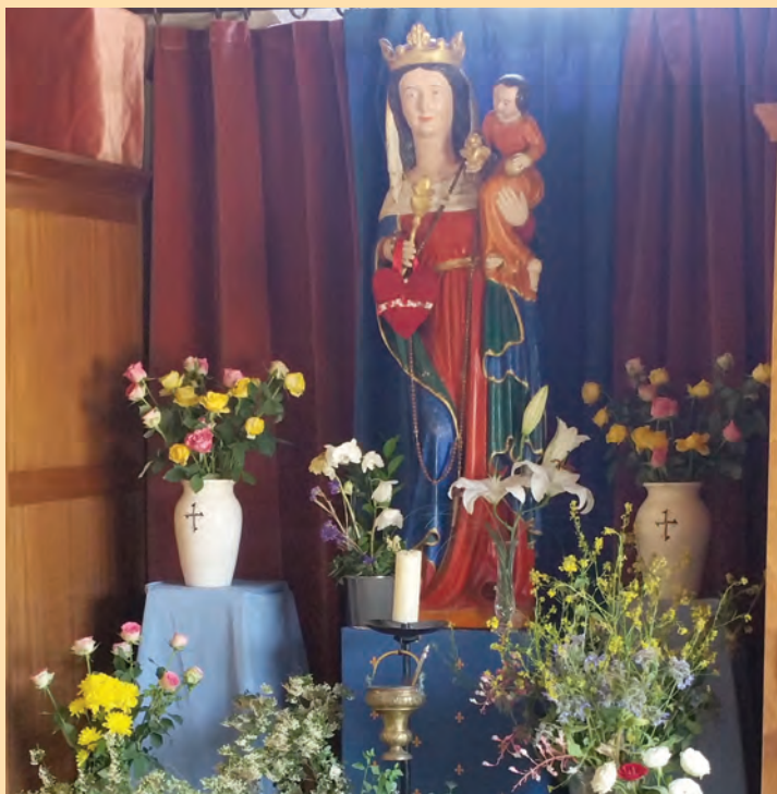
Vierge de notre portique, mois de Mai