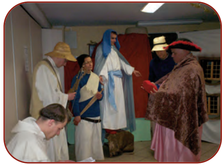
Récréation du 1 er janvier

Comme il est de coutume dans de nombreux couvents et monastères, une après-midi récréative rassemble la communauté. Les frères convers et les frères donnés ont adopté une pièce du Moyen-Âge narrant les aventures d'un troubadour de Notre-Dame en la nuit de Noël. Les frères étudiants montrent leurs talents d'instrumentistes en accompagnant à la flute, au piano et à la guitare, de joyeux chants de Noël que nous ont envoyés nos frères capucins.