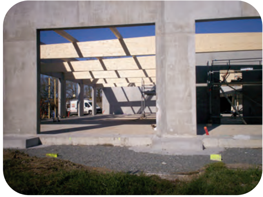
Installation de la charpente début mars

qui a reculé devant les progrès de l'Église, s'est maintenu dans les sociétés secrètes, spécialement la franc-maçonnerie. Celle-ci a pris peu à peu le contrôle des sociétés civiles, par son influence sur les médias, sur les institutions financières et sur les partis politiques. Plus récemment, à l'occasion du concile Vatican II, elle a pris un certain contrôle sur la hiérarchie de l'Église catholique, ce qui explique la situation lamentable de cette dernière.