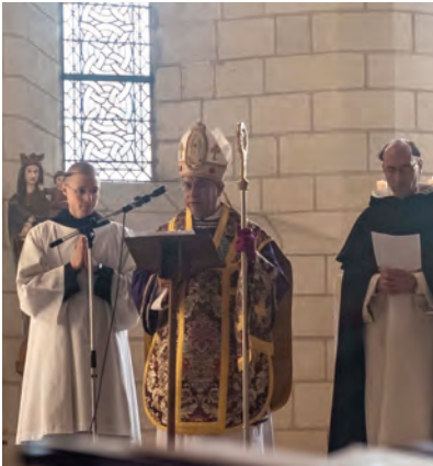
Sermon du 4 mars

gieuse contre tous ses détracteurs. Insensés ! Insensés, comme ces barbares qui insultent le soleil, ils insultent ses splendeurs. Mais le soleil