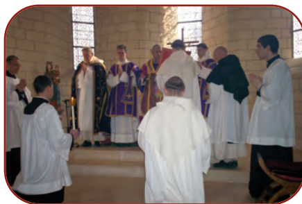
Ordinations du 4 mars