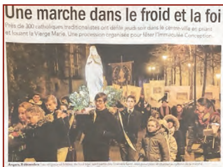
Dans le journal du 10 décembre

«Accueillez, Seigneur, nos prières et, par votre intervention salutaire, rendez prospère le voya-