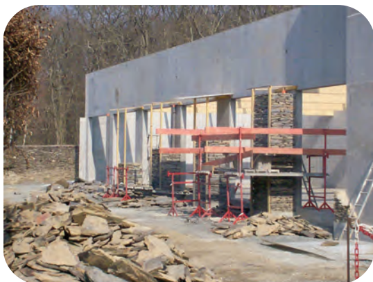
Les piles de schiste montent le long de la façade

La lutte a continué pendant vingt siècles par alternance de victoires et de défaites. D'une façon générale l'Église a dominé le combat : les